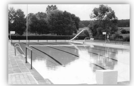
„Ludwig-Bender-Bad“ in früheren Zeiten

Das moderne Freibad verfügt über ein Edelstahlbecken von 15 x 50 m mit Wasserrutsche und Sprungbrettern (1 m und 3 m) sowie über ein attraktives solarbeheiztes Kindererlebnisbecken aus Edelstahl mit einer kleinen Hangrutsche, einem Wasserigel, einem Wasserpilz sowie einem großen Sonnensegel. Für unsere kleinen Besucher steht ein gut ausgestatteter Spielplatz zur Verfügung.