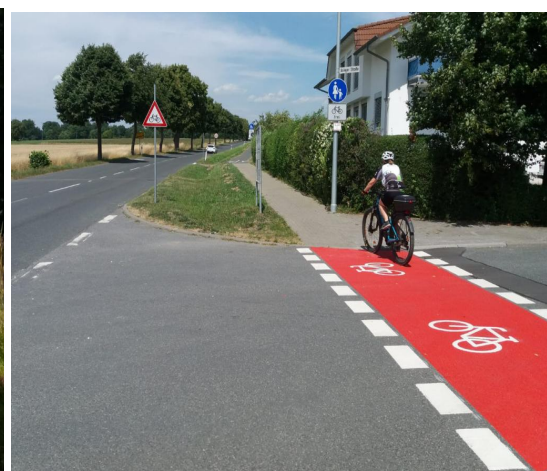
Sicherung der regionalen Radhauptverbindung/Schulweg Oberloh/Usinger Straße an 3 Einmündungen