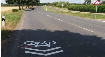
Absicherungen der Auflösung des Zweirichtungsradweg wegen fehlender Wegebreite durch Warnschilder, Radpiktogramme. Sicherung des Kreisels durch Radpiktogramme und Radbeschilderung