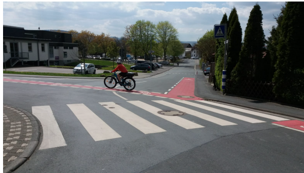
Schulwegsicherung und Öffnung der Einbahnstraße Schulstraße