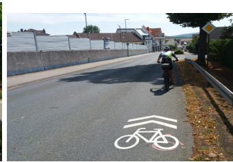
Absicherung Useringer Straße bis zur 30 km/h Zone Altstadt durch Radpiktogramme