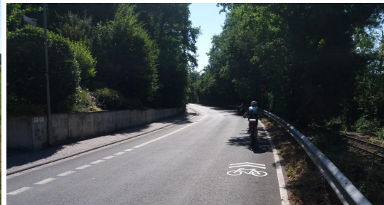
Radpiktogramme Sicherung Saalburgsiedlung