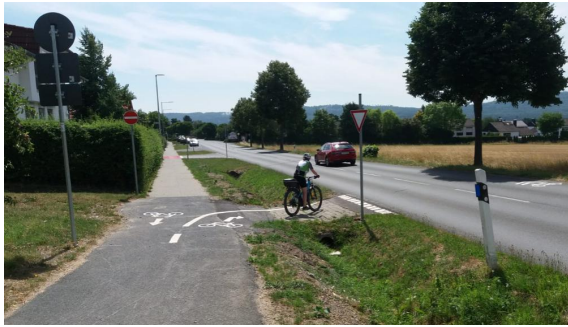
Auflösung des Zweirichtungsradweges wegen fehlender Wegebreite