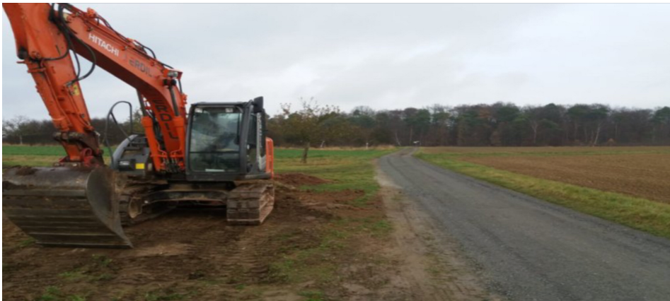
Renovierung des Radweges Wehrheim-Pfaffenwiesbach (1. Bauabschnitt Friedhof/Schlink)