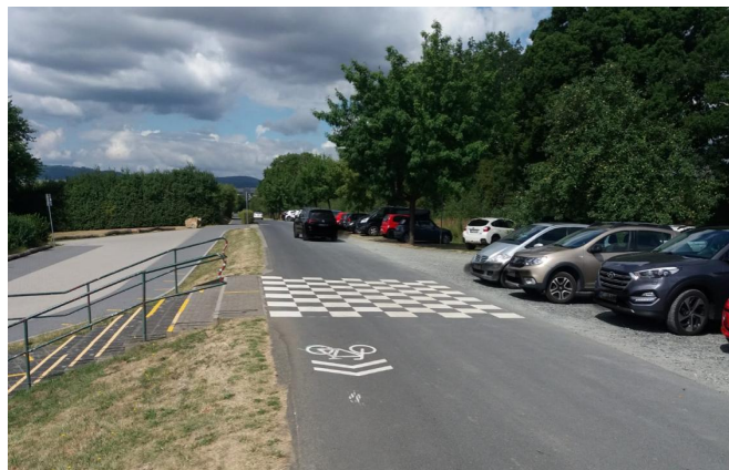
Sicherung Radweg Rodheimer Straße/Schwimmbad nach der Engstelle Friedhof u. Auflösung wegen fehlender Wegebreite Sicherung Eingangsbereich Schwimmbad durch Schachbrett, Radpiktogramme und 30 km/h Zone