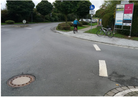
Fahrradgerechter Umbau der Auffahrt aus dem Kreisel in Richtung Oberloh