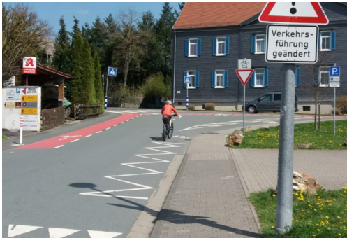
Sicherung Radverkehr durch Vorfahrtsregeln