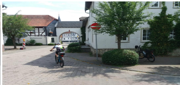
Öffnung aller möglichen Einbahnstraßen für den Radverkehr in Wehrheim