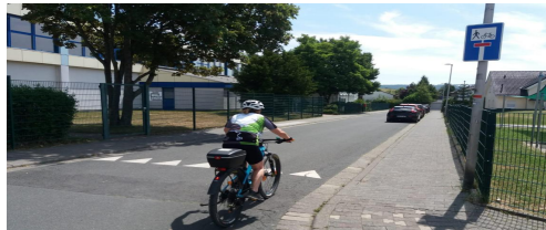
Sicherung der Engstellen im Wohngebiet Stecker und Öffnung von Sackgassen