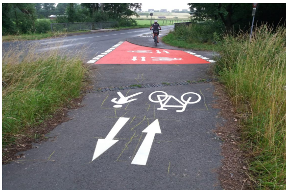
Sicherung Radweg Obernhain an der Erlenbachbrücke