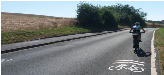
Radpiktogramme Regionale Radhauptverbindung Köpperner Straße