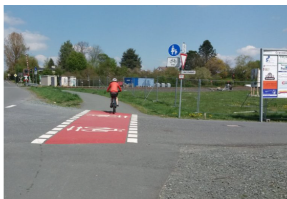
Sicherung Radweg Obernhain an insgesamt 4 Einmündungen