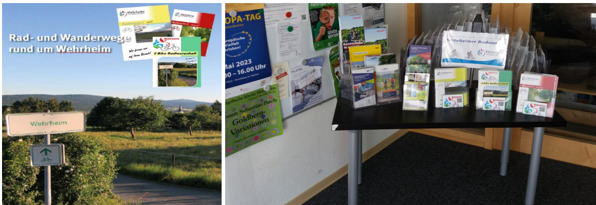
Herausgabe E-Bike Radtourenheft Neugestaltung Radtouristik Wehrheim im Foyer des Rathauses

Radinfos: https://www.wehrheim.de/kultur-freizeit/tourismus-fremdenverkehr/rad-wandertouren/